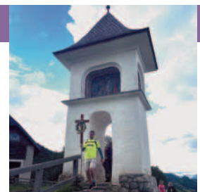
Wir ziehen zur Mutter der Gnade, zu ihrem hochheiligen Bild!